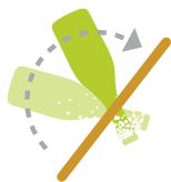
Gradänderung auf fast senkrecht Cambio dell'angolazione Gradually moving