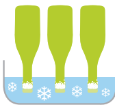
Kältebad Congelamento Cold brine