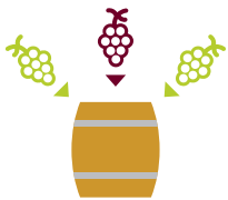
Grundwein Vino base Base wine