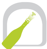
Enthefung Sboccatura Disgorging