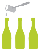
Dosage Dosaggio Dosage