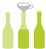
Abfüllung in Flaschen Imbottigliamento Bottling