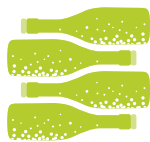
Flaschengärung Fermentazione in bottiglia Fermentation in the bottle